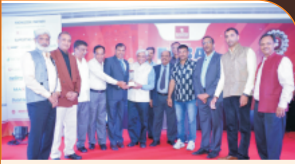
બેકીંગ ફ્રન્ટીયર્સ એવોર્ડ ૨૦૧૫ બેસ્ટ ચેરમેન એવોર્ડ તથા બેસ્ટ NPA મેનેજમેન્ટ એવોર્ડ સ્વીકારતા બેંકના હોદ્દાચોશ્રીઓ.