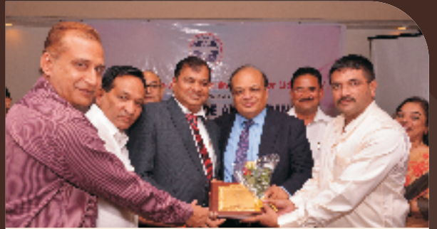
સાઉથ ગુજરાત કો.ઓ.બેંક ફેડરેશન આયોજીત આઠમો સ્કોબા પ્રાઈડ એવોર્ડ સ્વીકારતા બેંકના હોદ્દાચોશ્રીઓ.